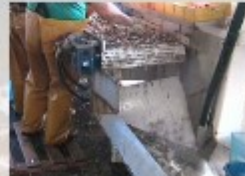
f) Scarico in mare dei detriti

Linea riprogettata con i singoli elementi in successione