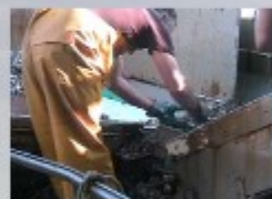
c) Controllo saltuario all'inizio del convogliamento sul tapis-roulant