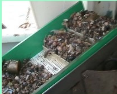
Nastro di carico e lavaggio