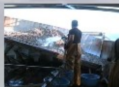
b) Spinta del pescato verso destra con acqua e suo prelavaggio