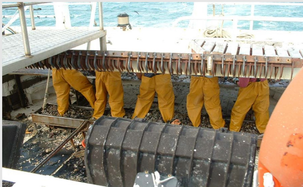
Cernita a poppa con operatori in piedi

RISULTATI RAGGIUNTI E ATTESI la realizzazione del piano di poppa regolabile in altezza tramite meccanismo pneumatico ha comportato una netta riduzione del rischio derivante dalle posture incongrue e dal sovraccarico del rachide consentendo ai marinai di compiere una lunga cernita a schiena eretta. Sono state evidenziate anche alcune modifiche relative all'organizzazione del lavoro come la riduzione dei tempi di cernita a poppa e la conseguente possibilità di godere di tempi di recupero.