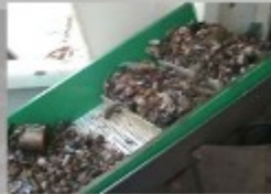
d) Tapis roulant in salita verso il piano di cernita