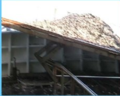
Piano di poppa rialzabile ed inclinabile

La linea è costituita da un sistema di nastri (tapis roulant) che dal pianale di poppa, rialzato ed inclinabile, trasportano il pescato su un nastro di carico, su un nastro di lavaggio (inclinato) e poi su un nastro di cernita che decorre in piano e permette una permeabilità ai flussi di lavaggio creati per il percolamento dei residui. Possiede anche dei deflettori per l'eliminazione automatica dei residui. L'ultima parte della linea è costituita dal selettore dei prodotti residui. Tutta la linea è fissata in modo permanente al ponte di coperta ed è dotata di pulsante di stop e di regolatore di velocità.