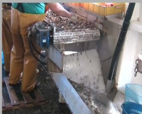
Eliminatore di residui