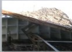
a) Piano di scarico del pescato elevabile e inclinabile

Le principali componenti e fasi operative del nuovo lay-out con piano mobile e cernita protetta sono: