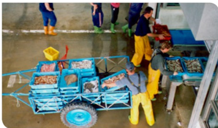
II-6. Buona attrezzatura per il trasporto manuale.