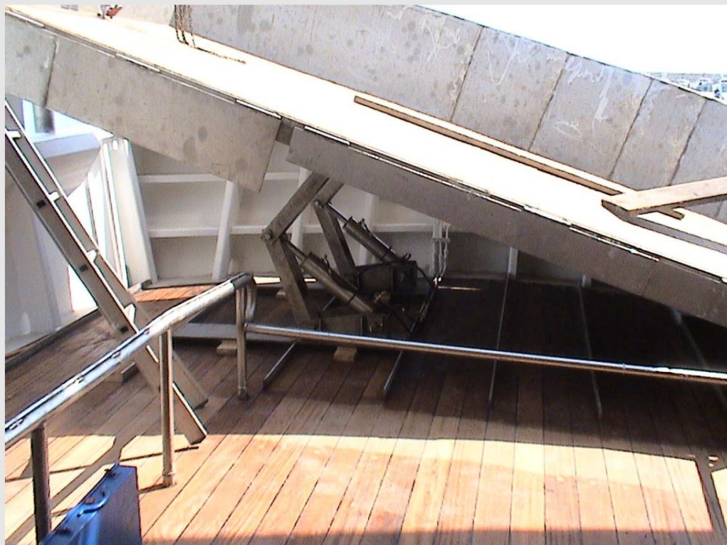
Particolare del piano di poppa rialzabile con meccanismo pneumatico

OVE POSSIBILE, ALLEGARE FOTO e/o ILLUSTRAZIONI DELL'ESEMPIO DI BUONA PRASSI, per esempio fotografie di un ambiente di lavoro riprogettato, materiale illustrativo relativo alle azioni intraprese o materiale di formazione.