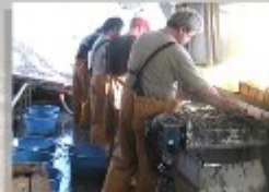
e) Piano di cernita mobile ad avanzamento controllato dagli operatori