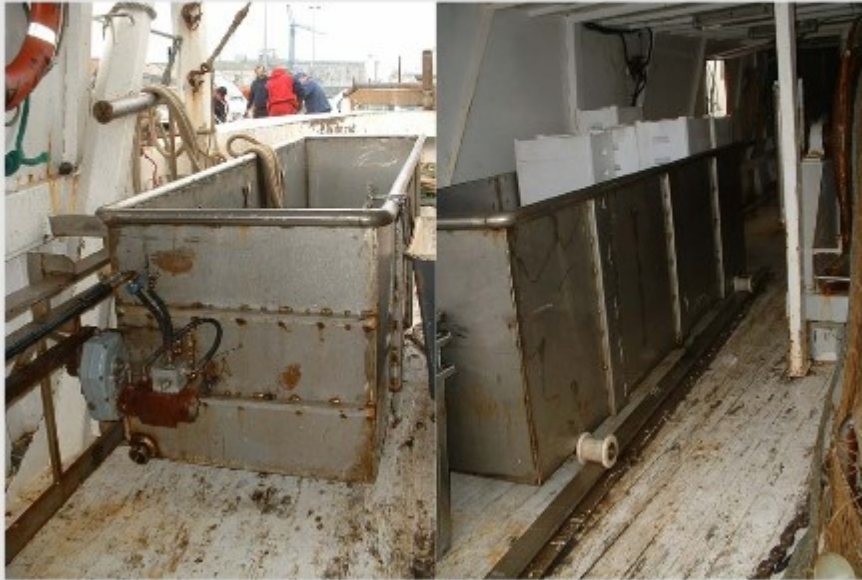
vasca mobile su rotaia