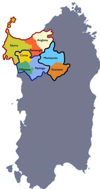
Figura 1 - Territorio ASL di Sassari